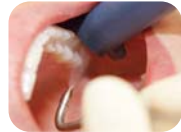
Beläge entfernen mit Pulverstrahlgerät

Es werden außerdem vorhandene Verfärbungen (Raucher-, Tee-, Rotweinbeläge) mit speziellen Pulverstrahlgeräten beseitigt.